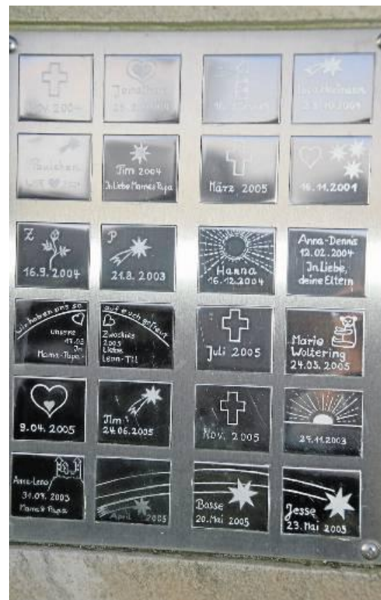
Hier geht niemand verloren ....