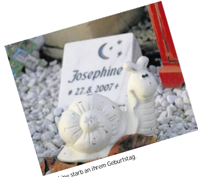
Josephine starb an ihrem Geburtstag.