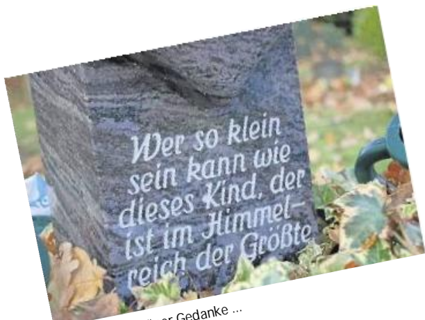
Ein wirklich schöner Gedanke ...

schwisterkindern Halt, Sicherheit und Zuwendung geben. Wir MZ-Kinderreporter möchten heute – anlässlich des Totensonntags – einige nachdenkliche Momente schaffen: Bilder von Grabstätten für Kinder und Erfahrungsberichte von Eltern, die ihr Kind verloren haben.