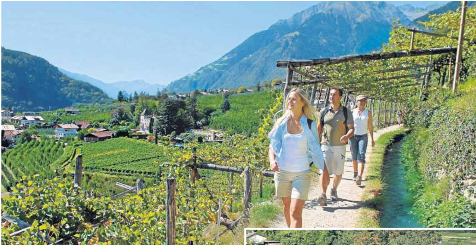
Algund in Südtirol ist der ideale Ausgangspunkt für unternehmungslustige Urlauber. Mit der Algund PlusCard gibt es auch bei der Vinschgaubahn Ermäßigungen (links).

Algund PlusCard bietet viele Vergünstigungen