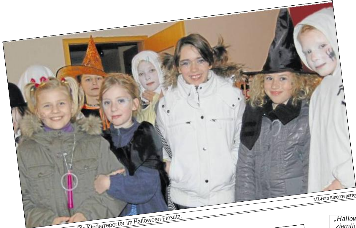
Zum Gruseln schön: Die Kinderreporter im Halloween-Einsatz.

merzialisiert wird und hin und wieder auch zu Auswüchsen führt, die zahlreiche Einsätze der Polizei an erfordern. Fest steht: Die Freizeitindustrie verdient an diesem vermeintlichen Feiertag am meisten mit. Auch mit katholischen Christen gibt es Konflikte wegen Halloween: der folgende Tag, Allerheiligen, ist schließlich ein so genannter „stiller Feiertag“. An einem solchen Tag sind Tanzveranstaltungen verboten – und das Verbot gilt ab Mitternacht. Insa Duvos